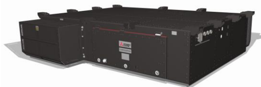
Elektrisk utrustning som levereras till Delhi Metro (drivomvandlare)