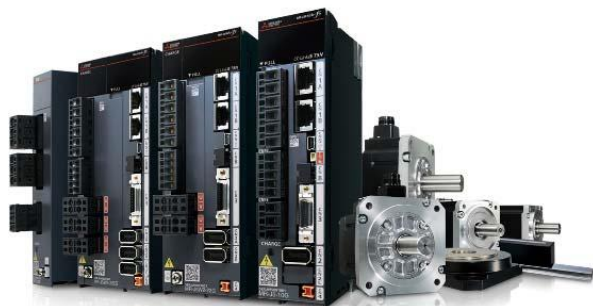
Mitsubishi Electric servosystem

3 En integrerad lösning som bygger på industriell automation och IT med syftet att minska den totala kostnaden för att utveckla, producera och underhålla produkter.