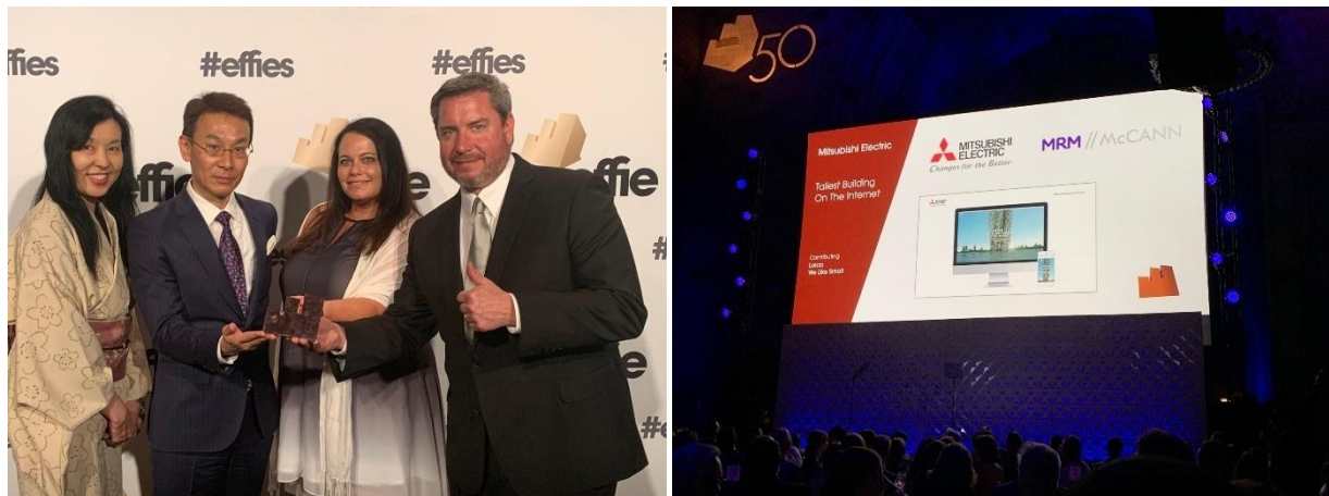
Effie Awards-ceremonin (lokal tid den 30 maj 2019 : i New York • Effie US GALA)

TOKYO 3 juni 2019 – Mitsubishi Electric Corporation (TOKYO: 6503) meddelade idag att webbplatsen för Mitsubishi Electric US, Inc. Building Solutions tilldelats bronspiset i kategorin Business-to-Business (BtoB) av Effie Awards, ett internationellt belöningsprogram som uppmärksammar spetskompetens inom marknadsföring. Mitsubishi Electric är den enda vinnaren i kategorin BtoB i år, och det tros vara första gången som en japansk tillverkare av hemelektronik har fått utmärkelsen Effie Awards i den här kategorin.