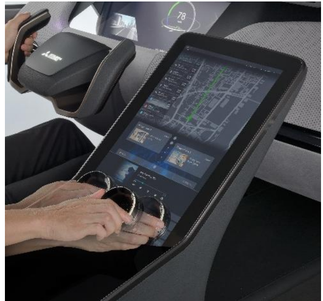
Display med reglage