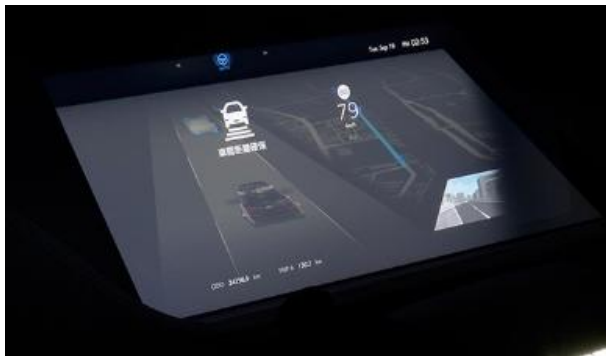
Display med korsande bilder