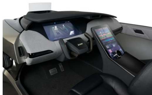
EMIRAI 4, interiör

Under temat ”Känner med dig: bekväm, säker och bekväm för alla”, har utvecklingen av den nya konceptbilen utnyttjat tre specifika forskningsområden: elektrifiering, autonom bilkörning och anslutning. EMIRAI 4 har nästa generations förarhjälpstekniker såsom människa-maskin-gränssnitt (HMI), föraravkänning och belysningsystem. HMI-innovationer som ingår i EMIRAI 4 innefattar: