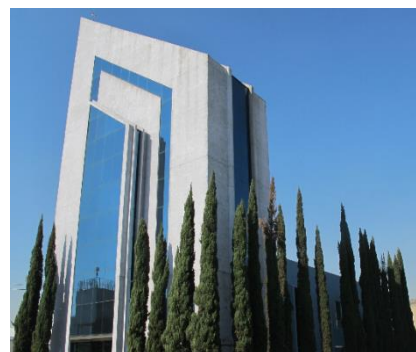
Mexico City FA Center ligger inom Mexiko-avdelningen, Mitsubishi Electric Automation, Inc.