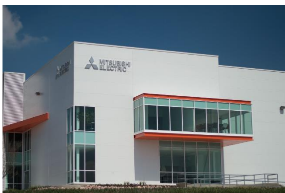
Mexico FA Center ligger inom Querétaro-kontoret, Mitsubishi Electric Automation, Inc.

TOKYO, 12 maj 2017 – Mitsubishi Electric Corporation (TOKYO: 6503) meddelar idag att Mexiko-verksamheten har upprättat två nya serviceanläggningar för fabriksautomation (FA) – Mexico FA Center i Queretaro och Mexico Monterrey FA Center i Nuevo Leon. Det utbyggda nätverket kommer att göra det möjligt för Mitsubishi Electric att stärka och påskynda såväl kundsupport som service av FA-produkter i Mexiko. Båda centern öppnar den 15 maj.