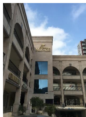
Mexico Monterrey FA Center, ligger inom Monterrey Office, Mitsubishi Electric Automation, Inc.

Investeringar i tillverkning ökar i Mexiko, exempelvis i el- och elektroniksektorn. Trenden förväntas bidra till ökad efterfrågan på FA-enheter och en mängd olika tjänster med anknytning därtill.