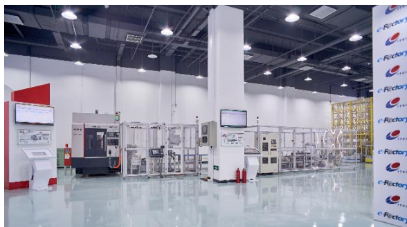
ITEI Smart Manufacturing Comprehensive Test Platform ( heltäckande testplattform för intelligent tillverkning)